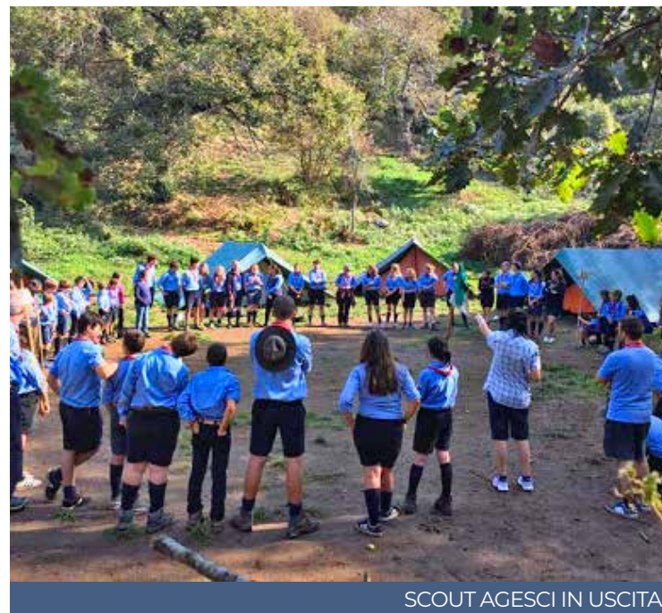
SCOUT AGESCI IN USCITA

Il tema della comunicazione, l'idea che noi siamo quello che comunichiamo, la comunicazione nonviolenta vissuta con i ragazzi più grandi, momenti guidati da persone competenti. Ma questo è stato un tempo anche per noi capi: l'Agesci ci ha detto: «Fermati! Ripensati come educatore, quale senso ha il tuo essere capo in questa situazione nuova?» E ha proposto un cammino di riflessione, #fanuovetuttele cose e #chia-