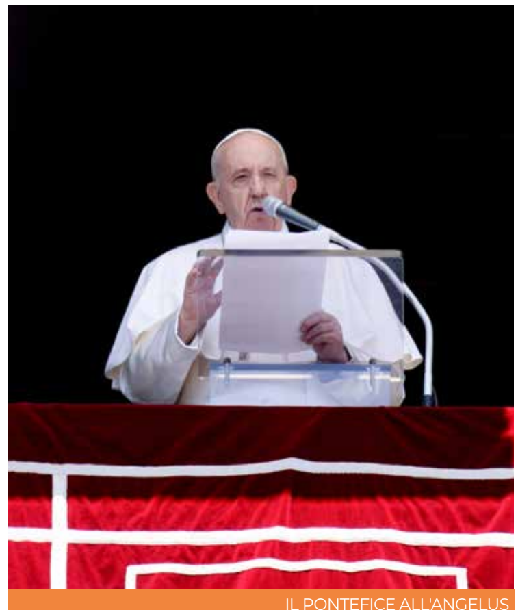
IL PONTEFICE ALL'ANGELUS

L'atteggiamento dell'intercessione «è proprio dei santi che, ad imitazione di Gesù, sono "ponti" tra Dio e il suo popolo. [...] Gesù è il "pontifex", è il ponte fra noi e il Padre, intercede per noi, fa vedere al Padre le piaghe che sono il prezzo della nostra salvezza». L'esperienza di Mosè, ha mostrato il Papa, «ci sprona a pre-