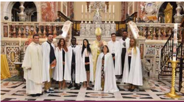
I CATECUMENI AL TERMINE DELLA CELEBRAZIONE

«Tutta la Chiesa ringrazia il Signore Gesù che da sempre vi ha conosciuti e vi ha scelti per essere Suoi figli. Se siete qui oggi è perché il Signore vi ha ascoltati, ha cercato voi che cercavate Lui, vi ha attenti-