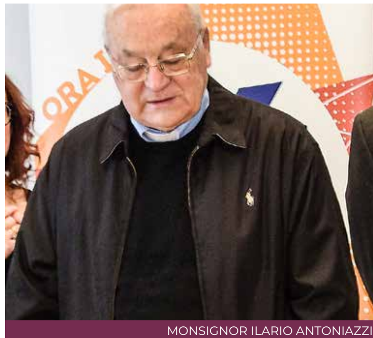
MONSIGNOR ILARIO ANTONIAZZI

Fondamentale è stata la presenza dei medici tunisini che collaborano con la nostra Caritas. Una rete che da anni ci consente di assicurare le cure agli ammalati, che si è rivelata ancora più utile durante il coronavirus, quando non sapevamo dove mandare gli ammalati affetti da altre patologie. E poi c'è stato l'impegno verso i detenuti: gli unici a cui, durante l'emergenza,