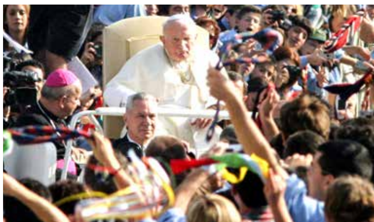
SAN GIOVANNI PAOLO II CON GLI SCOUT