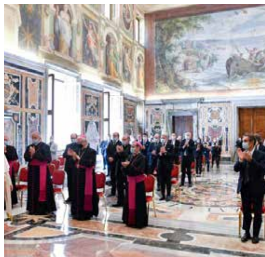
L'UDIENZA AL PERSONALE SANITARIO