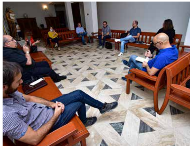
L'INCONTRO DI DONIGALA

Un dato importante, comune denominatore, è la decisione presa all'indomani dell'avvio del lockdown di non abbandonare il campo. I giornali diocesani sardi, infatti, sono rimasti attivi, magari con qualche correttivo nella programmazione, ma tutti hanno saputo rappresentare, materialmente, l'immagine di una Chiesa presente e militante, che si organizza e non si ferma, che opera in trincea e non nelle retrovie. Coloro che un domani, sfogliando le pagine dei settimanali diocesani sardi, vorranno rendersi conto di come hanno operato «Il Portico», «Nuovo Cammino», «Sulcis Iglesiente Oggi», «L'Arborese», «L'Ogliastra», «L'Ortobene», «Voce del Logudoro», «Dialogo» e «Libertà», potranno rilevare non solo l'impegno e la presenza, ma anche la narrazione puntuale dei fatti: le restrizioni, le decisioni dolorose ma necessarie, le reazioni di fedeli e sacerdoti, il ruolo centrale dei Vescovi. Questo, grazie soprattutto allo spirito di collaborazione e alla condivisione sistematica di contenuti e immagini che hanno costituito il punto di forza dei giornali diocesani. Ma c'è un dato che occorre saper leggere nel modo giusto e che, come ha rimarcato lo stesso Giampaolo Atzei, rappresenta una sorta di costante: il ricorso