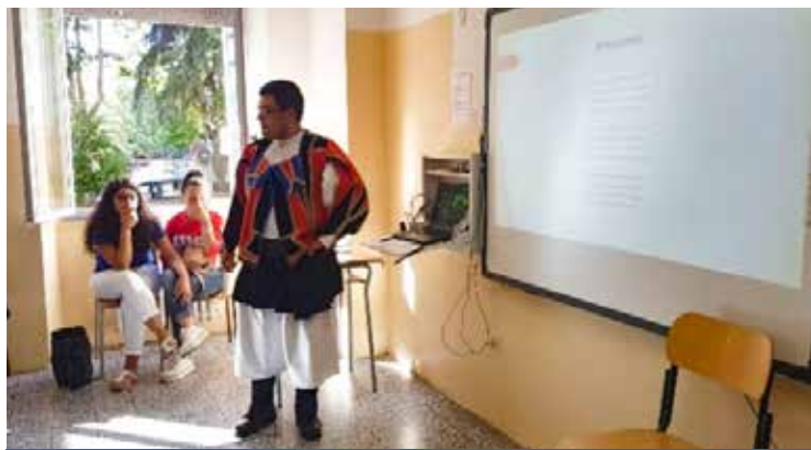
UN MATURANDO IN COSTUME TIPICO