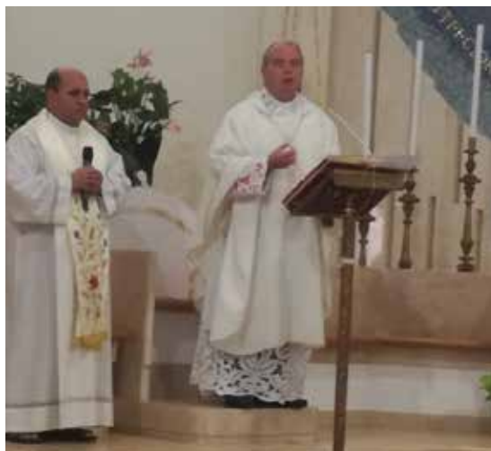
MONS. MIGLIO PRESIEDE LA MESSA

accadeva negli anni scorsi. Un modo per consentire a tutti di vivere un appuntamento sempre molto sentito nel quartiere. Le celebrazioni inoltre sono distanziate almeno di un'ora per consentire la corretta sanificazione di tutti gli ambienti, come imposto dalle norme». E non è mancata la processione del simulacro del Sacro Cuore per le vie del quartiere, pur senza la partecipazione di popolo. I fedeli hanno partecipato affacciati ai balconi e alle porte delle proprie abitazioni, rispettando le doverose distanze sociali e non creando assembramenti lungo le strade del popolare rione della terza città della Sardegna.