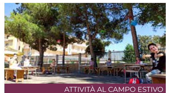
ATTIVITÀ AL CAMPO ESTIVO