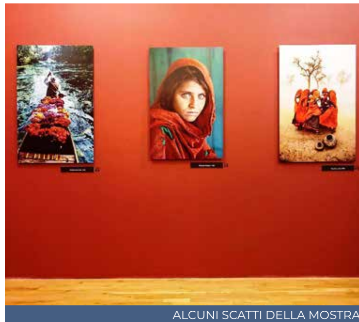
ALCUNI SCATTI DELLA MOSTRA

L'elemento umano è la chiave delle sue creazioni, la parte migliore, con prospettive tanto inconsuete. Prospettive che raccontano di sradicamento, di fame, di disperazione, di culture millenarie, di tradizioni che rischiano di sparire, di povertà; ma quella povertà che debilita il corpo e anche lo spirito. Nei volti si affaccia l'anima più genuina dei soggetti fotografati, la loro esperienza di vita, la loro condizione umana. Fragilità e debolezza dietro cui si nascondono bellezza, meraviglia, familiarità. Tutte le opere sono costituite da un'infinita varietà di visioni luminose e contrastanti, di odori e sapori di mondi altri a cui solo la forza del colore può rendere giustizia. I contesti in cui sono stati realizzati gli scatti sono i più vari: dalle strade ai mercati, dalla quiete dei fiumi alle rovine della guerra. I rumori dell'India ed i silenzi dell'Asia: posti bellissimi geograficamente, che noi