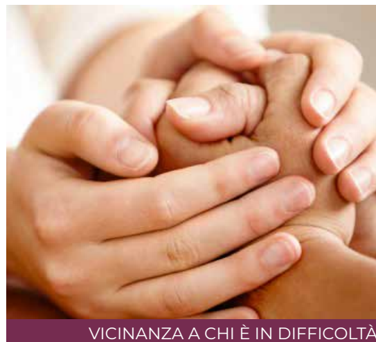
VICINANZA A CHI È IN DIFFICOLTÀ