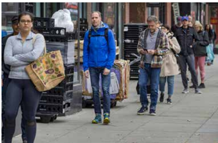
CLIENTI IN ATTESA DI ENTRARE IN UN SUPERMARKET