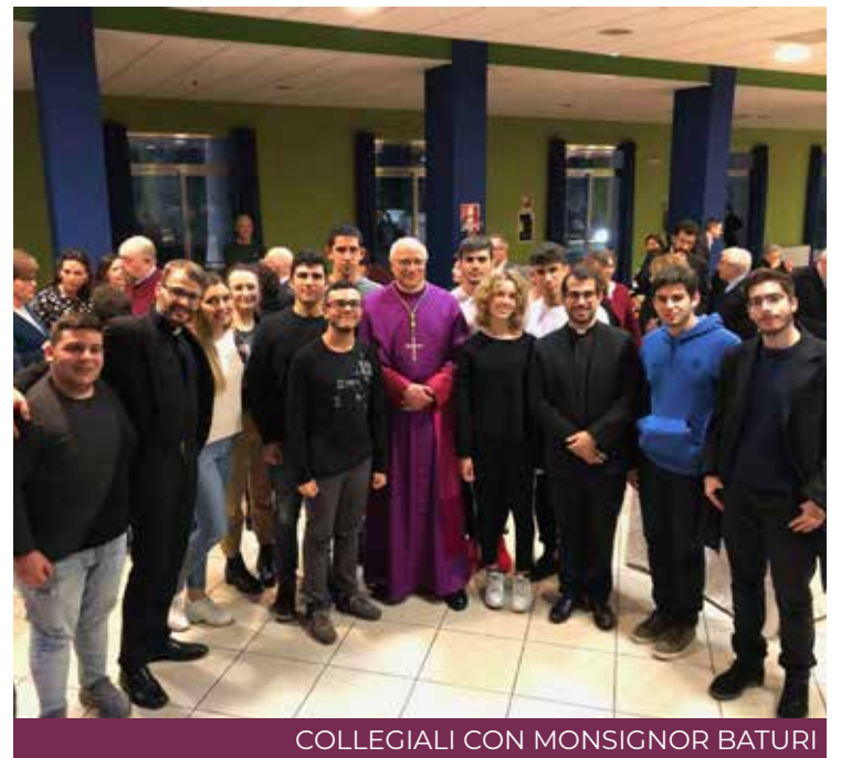
COLLEGIALI CON MONSIGNOR BATURI

Tante sono le novità in cantiere. Qui è sufficiente dire che, superata la selezione iniziale, i ragazzi ammessi in College avranno la possibilità di intraprendere un percorso di crescita integrale, basato su quattro pilastri: l'aiuto a vivere al meglio il proprio per-