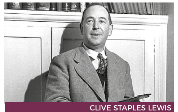
CLIVE STAPLES LEWIS