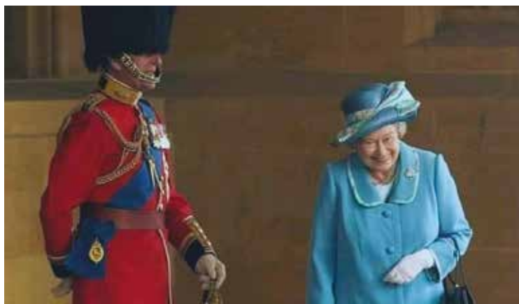
LA REGINA ELISABETTA II

La storia si è fermata per un momento, ha trattenuto il respiro per poi riprendere il suo percorso.