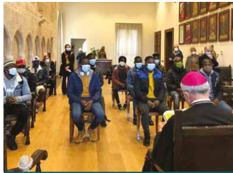
UN INCONTRO DELL'ARCIVESCOVO CON I MIGRANTI

un'intensa opera di costruzione nella quale tutti dobbiamo sentirci coinvolti in prima persona. Si tratta di un meticoloso lavoro di conversione personale e di trasformazione della realtà, per corrispondere sempre di più al piano divino». «I drammi della storia - scrive ancora il Papa - ci ricordano quanto sia ancora lontano il raggiungimento della nostra meta, la Nuova Gerusalemme, «dimora di Dio con gli uomini» (Ap 21,3). Ma non per questo dobbiamo perderci d'animo. Alla luce di quanto abbiamo appreso nelle tribolazioni degli ultimi tempi, siamo chiamati a rinnovare il nostro impegno per l'edificazione di un futuro più rispondente al progetto di Dio, di un mondo dove tutti possano vivere in pace e dignità». Una scelta già indicata anche dal cardinal Bassetti a Firenze. «Non si può