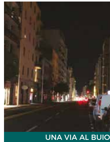
UNA VIA AL BUIO

Tra gli effetti dell'aumento delle tariffe di energia elettrica c'è anche quello delle luci spente per le strade di diversi Comuni dell'Isola. In alcuni piccoli centri i sindaci, non potendo sostenere più i costi delle bollette, hanno deciso di ridurre i consumi spegnendo i lampioni in molte strade, lasciando al buio i cittadini. Una scelta obbligatoria, secondo alcuni primi cittadini che mette però a rischio la sicurezza: il buio favorisce i malintenzionati, che potrebbero agire grazie proprio all'oscurità. Da qui la richiesta alla Regione di un intervento il più rapido possibile per aiutare le amministrazioni a sostenere i rincari energetici, che tra l'altro vanno a colpire le utenze degli uffici pubblici, come i Municipi, dove si svolge l'attività amministrativa. In realtà i contributi per fronteggiare il caro bollette sono anche arrivati, ma non sarebbero sufficienti a coprire l'incremento dei costi. Numeri alla mano le cifre sono davvero importanti: a Cagliari il conto è triplicato, sa-