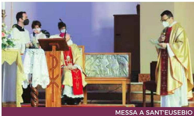
MESSA A SANT'EUSEBIO

Dopo due anni di stop forzato, ritorna, domenica, la festa di Sant'Eusebio, patrono dell'omonima parrocchia alle pendici del colle San Michele. Il Covid, che ha interrotto una tradizione risalente ai primi anni Sessanta del secolo scorso, ha raf-