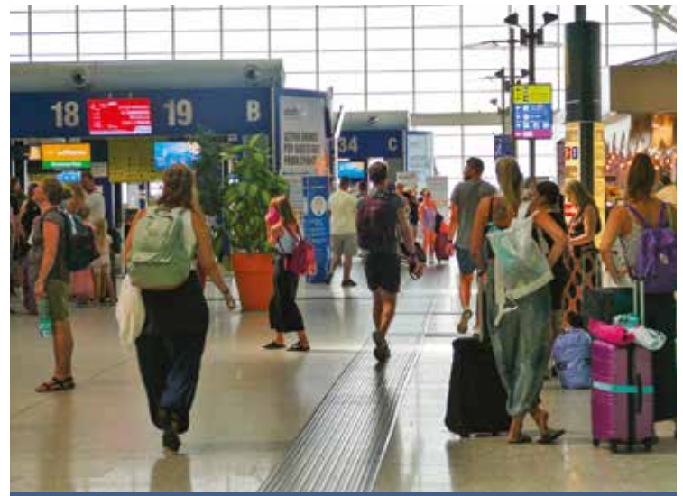
L'AFFOLLATO AEROPORTO DI CAGLIARI