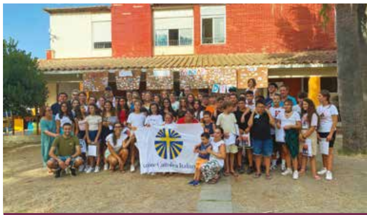
I PARTECIPANTI AL CAMPO

Il tempo dell'estate è per i soci dell'Azione Cattolica occasione preziosa per completare il cammino annuale, fatto di incontri, relazioni, attese e impegno condiviso.