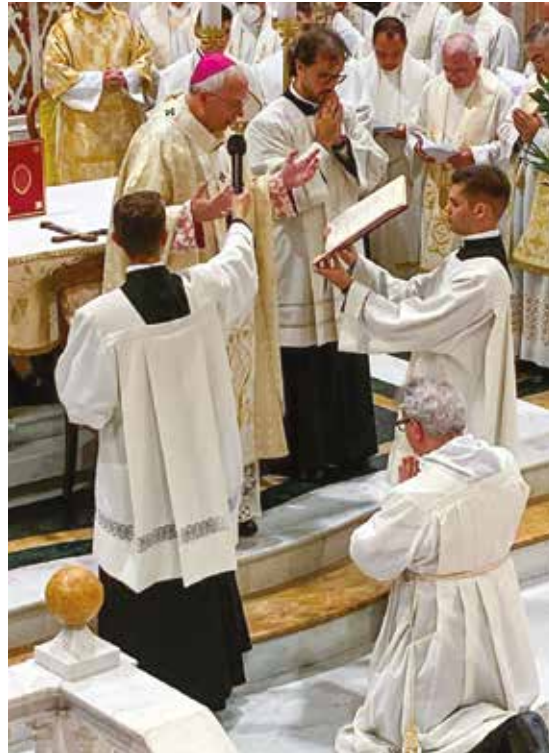
LA CELEBRAZIONE A SANT'ELENA

Baturi ha poi sollecitato i presenti alla celebrazione a prendere esempio dall'apostolo Paolo «che vive e lotta per annunciare agli uomini che Gesù Cristo è venuto al mondo per salvare i peccatori. Egli sa