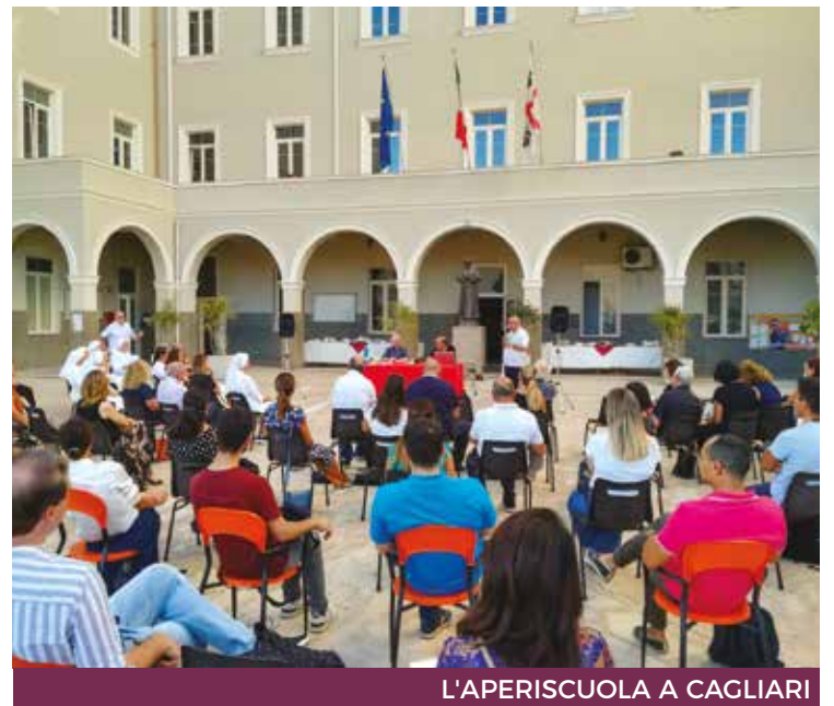
L'APERISCUOLA A CAGLIARI