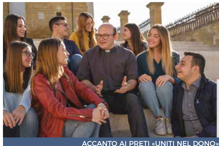
ACCANTO AI PRETI «UNITI NEL DONO»

Le offerte raggiungono circa 33.000 sacerdoti al servizio delle 227 diocesi italiane e, tra questi, anche 300 preti diocesani