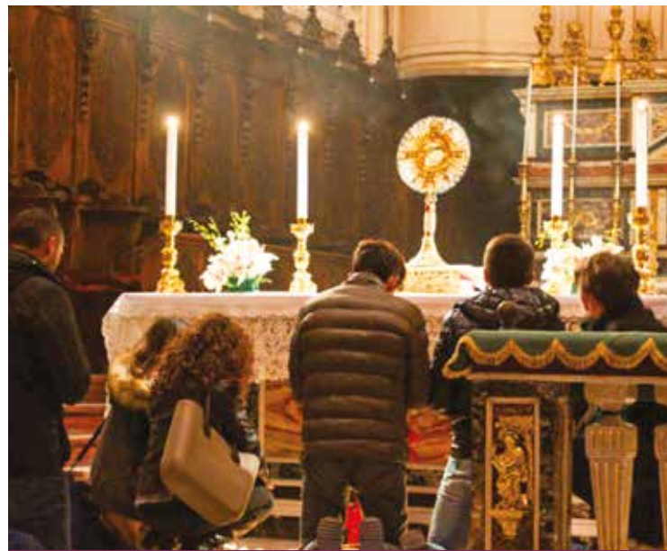
UNA FAMIGLIA IN PREGHIERA

Quanto poi al primo termine del titolo «Torniamo» per il direttore «indica la ripresa di una quotidianità delle famiglie che si sta perdendo, sia in termini di semplicità, pare che oggi le famiglie abbiano bisogno di tante cose costose e complicate per vivere, mentre la semplicità dei rapporti genera genuinità ma anche quotidianità, perché la vita delle famiglie è fatta dalle cose di tutti