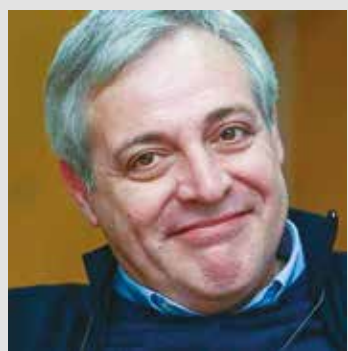
I. P. ©Riproduzione riservata

Il tema scelto per l'incontro è «Africa quo vadis?». L'appuntamento è inserito nell'ambito della mostra «Ancora un po' d'Africa», visitabile nel salone della parrocchia fino al 24 settembre. L'esposizione intende analizzare e approfondire alcuni temi più seri e anche drammatici, per capire il perché della fuga di tanti africani verso i Paesi ricchi.