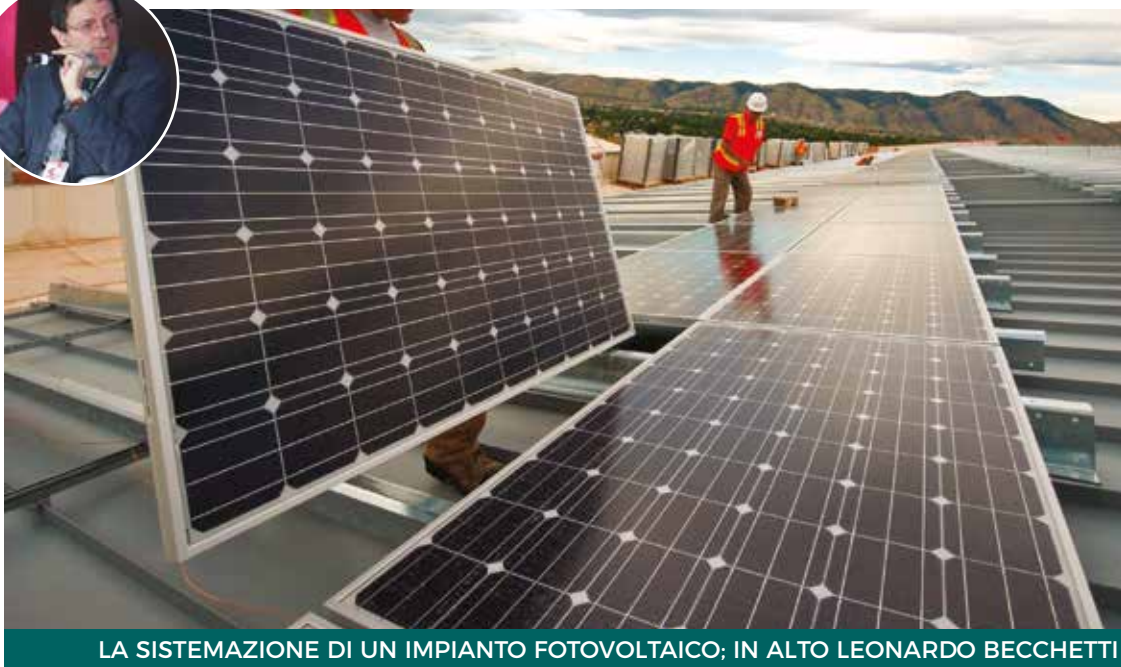
LA SISTEMAZIONE DI UN IMPIANTO FOTOVOLTAICO; IN ALTO LEONARDO BECCHETTI