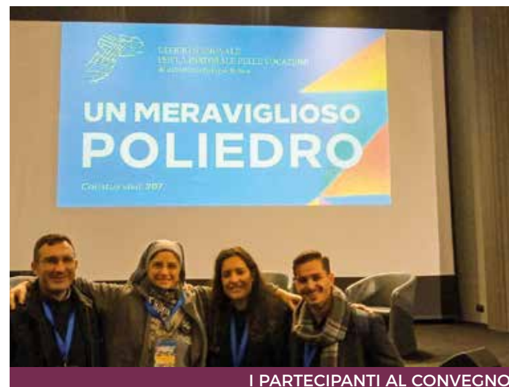
I PARTECIPANTI AL CONVEGNO

Sulla scia del cammino sinodale, i partecipanti si sono messi in ascolto delle diverse «storie» vocazionali per apprezzarne la bellezza e le peculiarità, hanno raccontato la propria e l'hanno condivisa con gli altri. Si è visto, così, che ogni faccia del «meraviglioso poliedro» della Chiesa è diversa dalle altre, ma tutte concorrono a formare un insieme organico e armonico. Un forte messaggio lanciato dal Convegno è che la «vocazione» riguarda essenzialmente ciò che è comune a tutti i cristiani, la chiamata alla vita cristiana con il Battesimo, cioè la