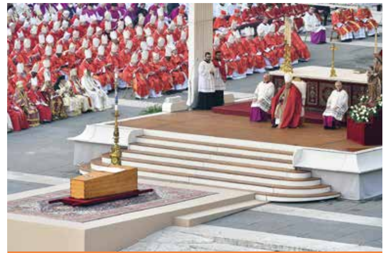
LE ESEQUIE DI PAPA BENEDETTO XVI

La dedizione è «sostenuta dalla consolazione dello Spirito», che, attraverso varie strade, guida la missione dei pastori: «Nella ricerca appassionata di comunicare la bellezza e la gioia del Vangelo, e nella testimonianza feconda di coloro che, come Maria, rimangono in molti modi ai piedi della croce».