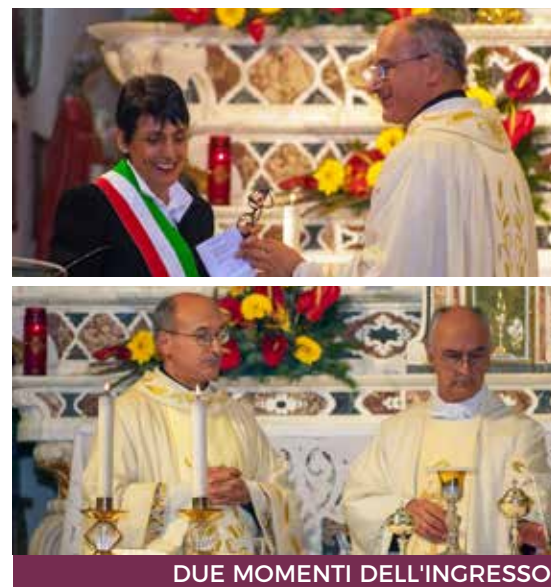
DUE MOMENTI DELL'INGRESSO