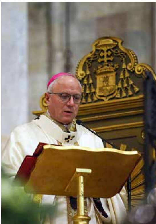
MONSIGNOR GIUSEPPE BATURI

«Benedetto XVI - ha ricordato Baturi - ha sempre indicato in questa trasformazione dell'amore la vera testimonianza cristiana nel mondo, che esige l'annuncio della fede come amica dell'umano e la diaconia della carità, ma sempre ad opera di un