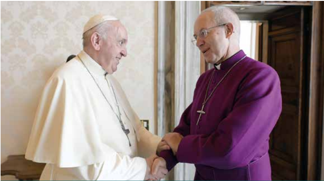
FRANCESCO E JUSTIN WELBY, ARCIVESCOVO DI CANTERBURY