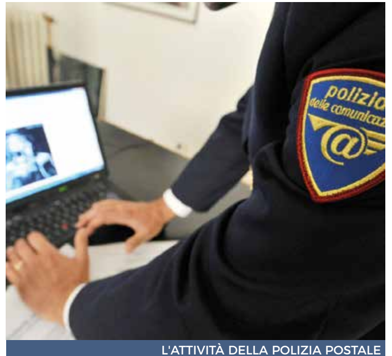
L'ATTIVITÀ DELLA POLIZIA POSTALE

Nello stesso anno si è rilevato come continui ad essere attivo il fenomeno dell'adescamento online che coinvolge soprattutto la fascia di età 10-13 e con un lento incremento dei casi relativi a bambini di età inferiore ai 9 anni. Per quanto riguarda la Sardegna, il Centro per la Sicurezza Cibernetica di Cagliari, coordinato dal Servizio Polizia Postale, ha eseguito la misura cautelare degli arresti domiciliari nei confronti di un uomo quarantenne residente nel Sud della Sardegna, resosi responsabile dei reati di interferenza illecita nella vita privata, di accesso abusivo ad un si-