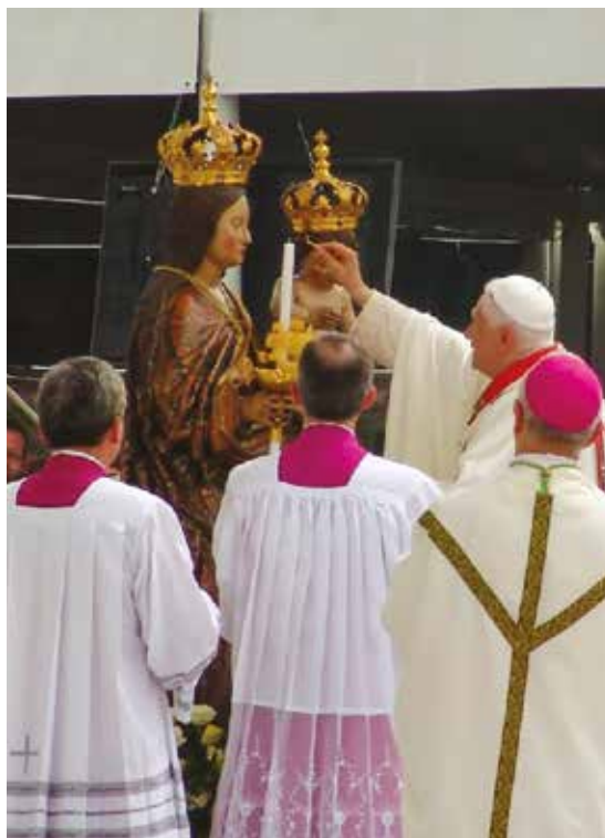
BENEDETTO XVI A CAGLIARI

na, ponendone in risalto la bellezza, la luminosità e la ragionevolezza. Credo abbia testimoniato in maniera esemplare, nella sua opera di teologo e pastore, quanto ebbe a dire nell'omelia per l'inizio del suo Pontificato: «Non vi è niente di più bello che essere raggiunti, sorpresi dal Vangelo, da Cristo. Non vi è niente di più bello che conoscere Lui e comunicare agli altri l'amicizia con lui» (24 aprile 2005).