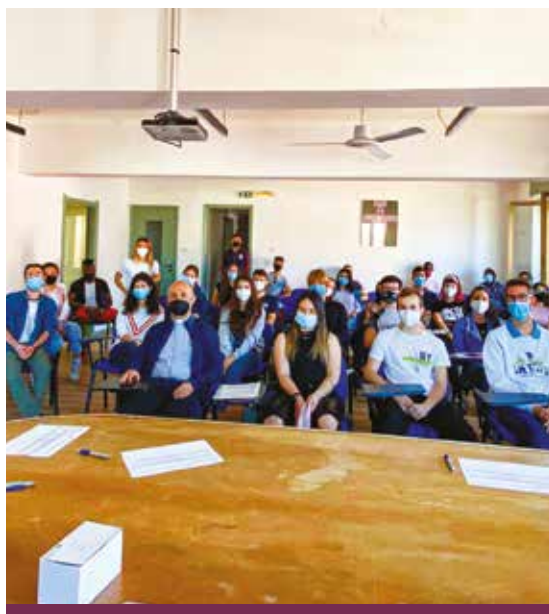
VOLONTARI DEL SERVIZIO CIVILE IN CARITAS