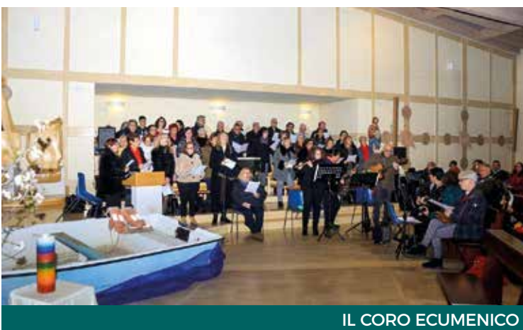
IL CORO ECUMENICO