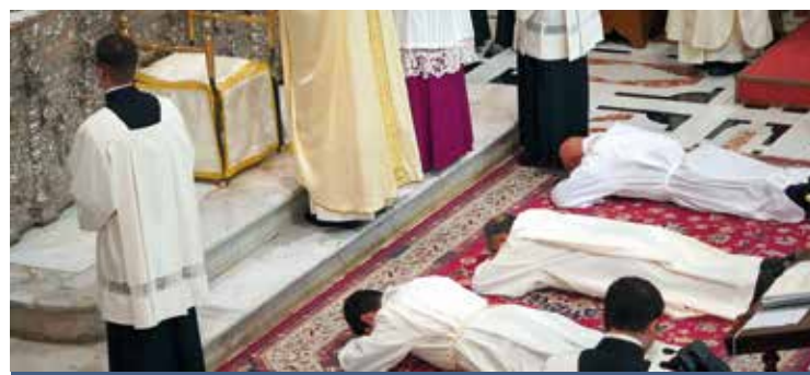
LA CELEBRAZIONE IN CATTEDRALE

e la salvezza degli uomini.». Per l'Arcivescovo la responsabilità principale del diacono è l'annuncio della buona notizia «la proclamazione del Vangelo - ha concluso - sia motivo per testimoniare e annunciarne la forza salvatrice a tutti gli uomini, nel lavoro come in famiglia, nell'impegno sociale come nella catechesi, in oratorio come in carcere».