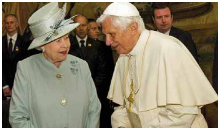
ELISABETTA II E BENEDETTO XVI

Gli emigranti italiani, assieme ai cattolici del Regno Unito, nel 2022 appena scivolato via, hanno perso due tra le figure più significative dell'ultimo secolo: la regina Elisabetta II e papa Benedetto XVI. Se è difficile riuscire a dire qualcosa di en-