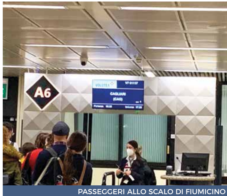
PASSEGGERI ALLO SCALO DI FIUMICINO

I sindacati sono preoccupati. «Sui cieli della Sardegna - ha denunciato il segretario generale Filt Cgil Sardegna Arnaldo Boeddu - si sta assistendo a un vero e proprio scontro tra compagnie e non una reale volontà di candidarsi per effettuare un servizio di trasporto aereo da e per la Sardegna».