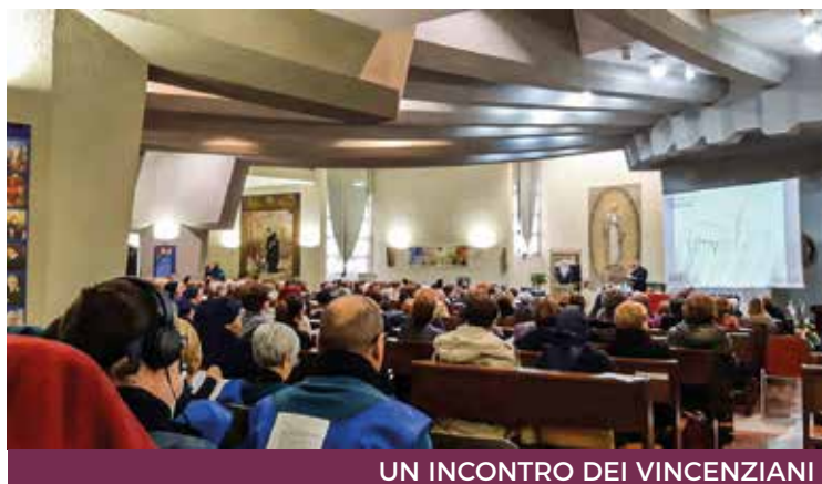
UN INCONTRO DEI VINCENZIANI

Gli annuali stati generali di formazione e aggiornamento della famiglia vincenziana sarda sono dedicati – il 15 e 29 gennaio (rispettivamente a Cagliari per Centro Sud Sardegna e Sassari per il resto dell'isola) – al cammino sinodale, il percorso di coinvolgimento