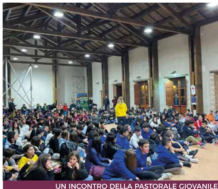
UN INCONTRO DELLA PASTORALE GIOVANILE

Quanto alle eventuali penali e assicurazione, l'acconto di € 250