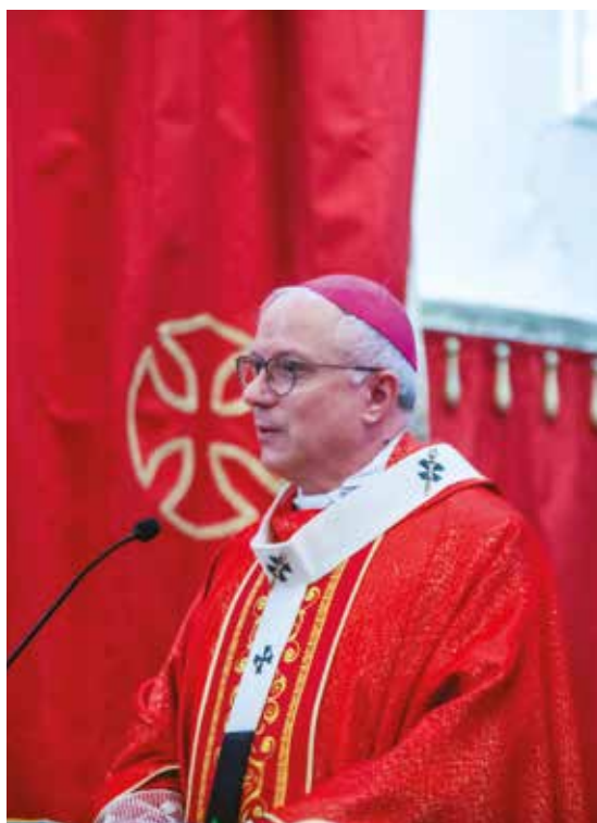
MONSIGNOR GIUSEPPE BATURI

Monsignor Baturi è poi ritornato sul brano del Vangelo della II Domenica del Tempo Ordinario nel quale Matteo racconta di Giovanni che indica Gesù come l'Agnello di Dio: «Ecco Colui che toglie il peccato del mondo». «Giovanni - ha evidenziato l'Arcivescovo - indica il presente della nostra storia, in questo oggi, Colui che può liberarci, che può compiere ogni attesa dell'uomo, la promessa di Dio. In noi c'è una fortissima spinta a guardare al futuro, così luminoso ma così lontano dal nostro presente, con il rischio che si apra un baratro davanti a noi. Non abbiamo bisogno solo di una promessa ma di