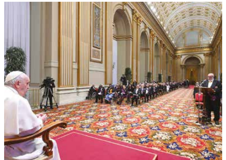
L'UDIENZA AL CORPO DIPLOMATICO

La pace si realizza nella solidarietà. Per il Pontefice ciò implica un impegno prioritario in alcuni ambiti: le migrazioni; l'economia e il lavoro; la cura della casa comune.