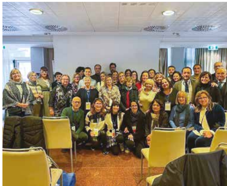
I PARTECIPANTI AL CONVEGNO NAZIONALE