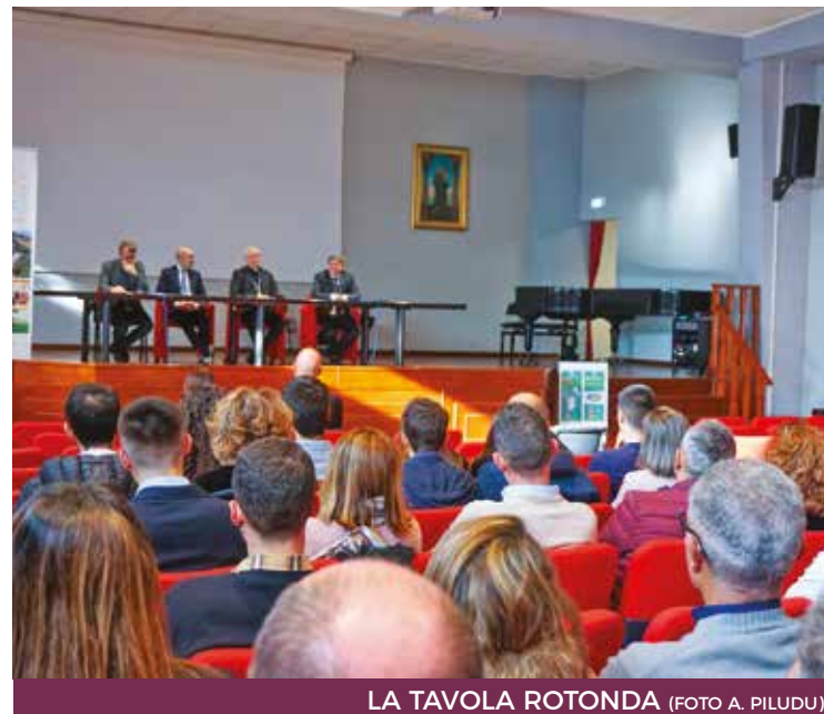
LA TAVOLA ROTONDA

si tratta di una questione relativa. Non esiste un risultato che possa essere ritenuto in sé un punto di arrivo, ma vanno tenuti in considerazione un insieme di fattori che rimandano sempre ad un cammino ancora da compiere, perché il conseguimento di un obiettivo pone immediatamente la questione del passo successivo da fare». L'Arcivescovo ha poi sottolineato come il tema del merito vada affiancato a quello della cura con la quale si è disposti ad accompagnare coloro dai quali ci si attende un risultato, senza tacere le fatiche che possono emergere durante il percorso accademico: «Ogni attività umana comporta un rischio, l'importante è non restare imprigionati nell'incertezza per paura di sbagliare. E quando questo capita, occorre saper dare un nome alla