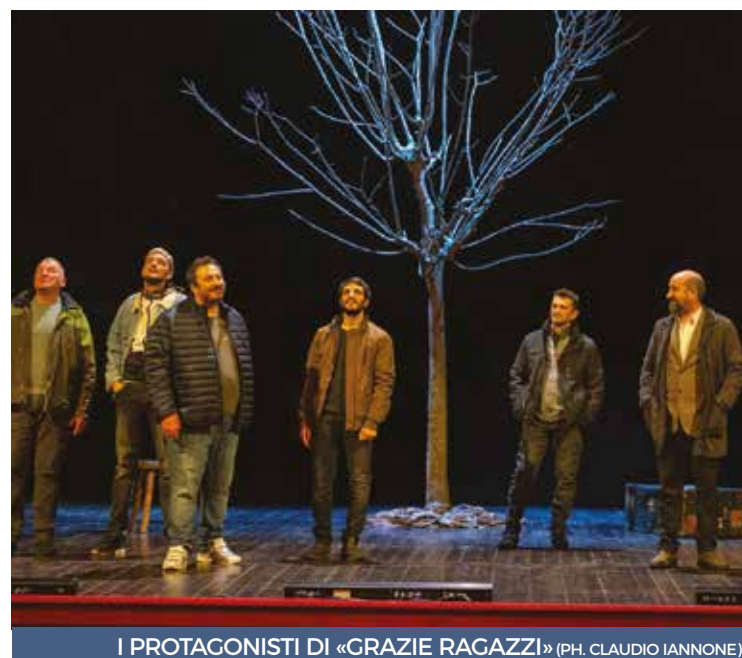
I PROTAGONISTI DI «GRAZIE RAGAZZI»

gando alto e basso, realismo e dinamiche da commedia brillante. La regia di Milani si sente nella sua agilità e solidità, come pure la presenza di un buon copione vivace. A dare corpo all'opera sono poi gli attori, tutti molto validi, di grande mestiere: accanto al già citato capocomico Antonio Albanese tengono bene il passo Sonia Bergamasco, Fabrizio Bentivoglio e Vinicio Marchioni. Ottimi! Infine, non va dimenticato che «Grazie ragazzi» è un'opera che mette a tema la vita nelle carceri, il bisogno di vedere tali strutture non solo come luoghi di detenzione ma (soprattutto) come spazi di recupero, di cambiamento.