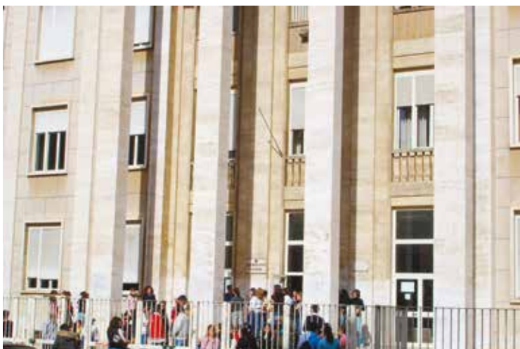
L'INGRESSO DEL LICEO «DETTORI»