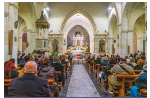
L'INGRESSO DI DON IGNAZIO SIDDI