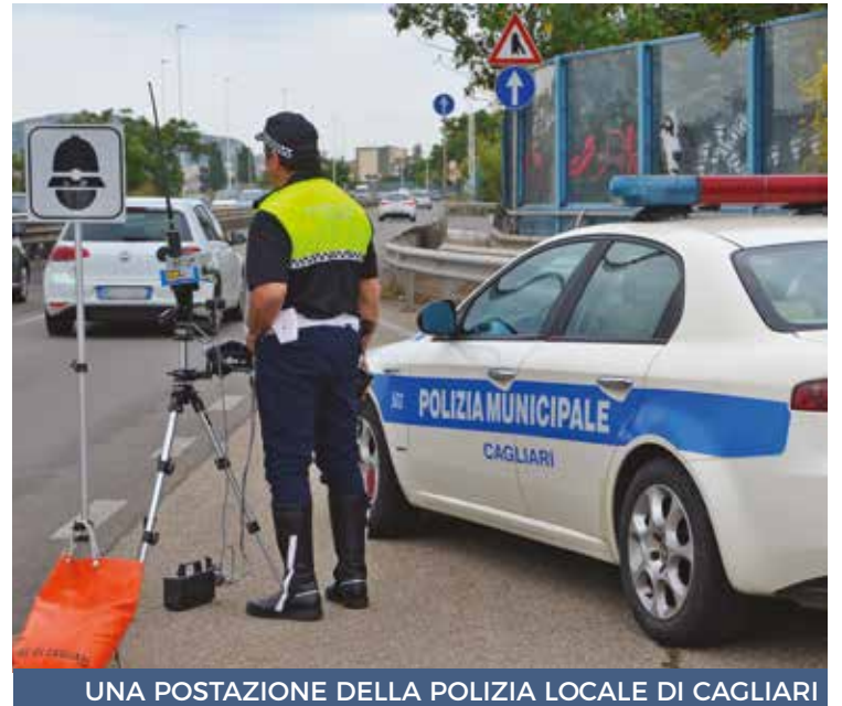
UNA POSTAZIONE DELLA POLIZIA LOCALE DI CAGLIARI

Radar della polizia municipale cagliaritano anche sui giovani e