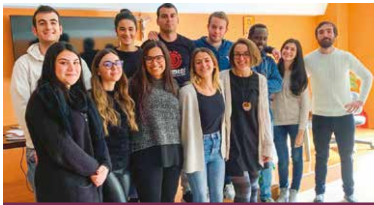
GIOVANI DEL SERVIZIO CIVILE IN CARITAS

Ci sono 31 posti messi a disposizione dalla Caritas diocesana di Cagliari, nell'ambito del nuovo Bando 2022 del Servizio civile universale, che ha visto l'approvazione dei sei progetti presentati attraverso Caritas Italia-