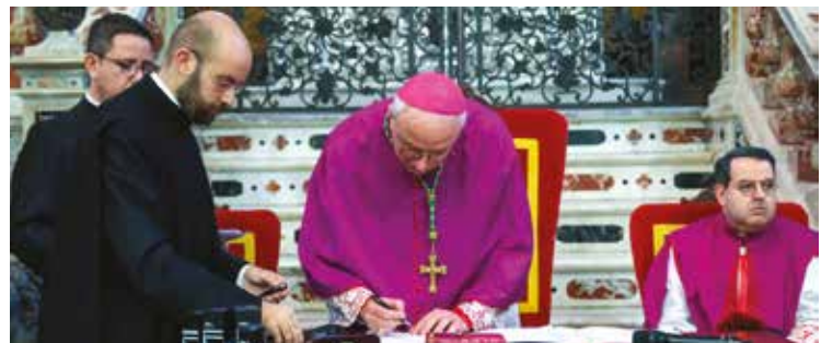
LA CERIMONIA IN CATTEDRALE