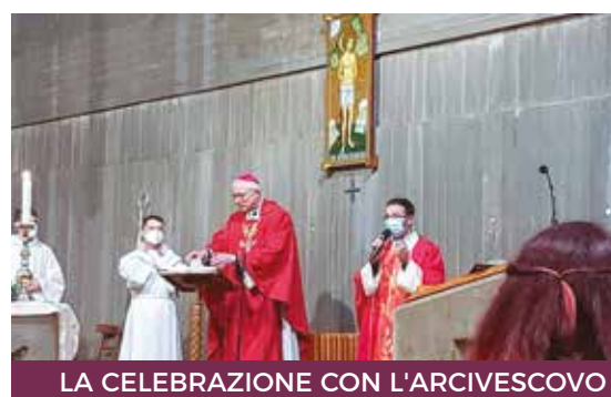
LA CELEBRAZIONE CON L'ARCIVESCOVO