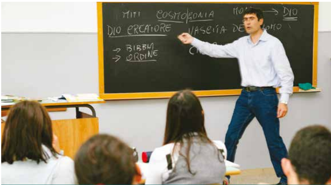
UN INSEGNANTE DI RELIGIONE