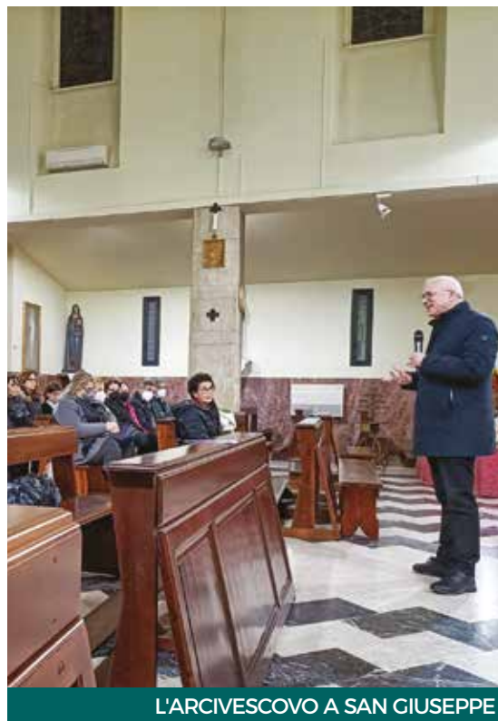
L'ARCIVESCOVO A SAN GIUSEPPE

I catechisti sono discepoli, testimoni, annunciatori. Non serve lamentarsi per ciò che non c'è, ma bisogna rendere grazie per ciò che è ora, in questo presente. La qualità della relazione è importante e occorre rendersi conto che c'è maggiore differenziazione nell'età della