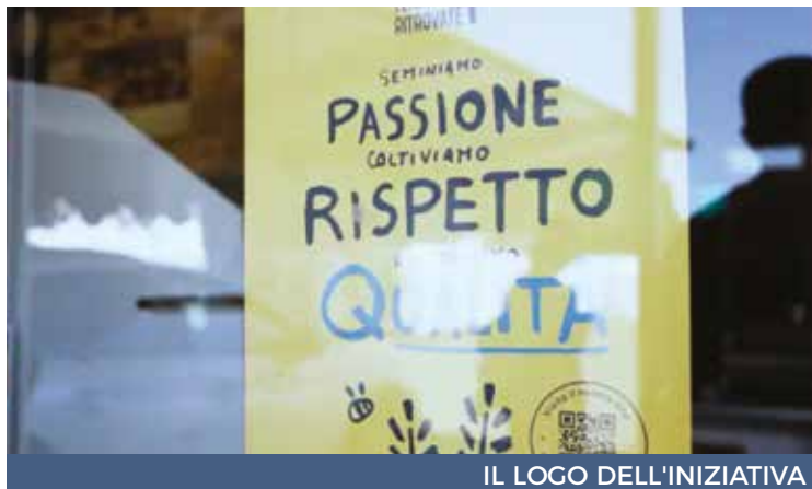
IL LOGO DELL'INIZIATIVA

T ra le testimonianze dei sacerdoti raccolte nell'ambito della campagna nazionale per le offerte deducibili «Uniti nel