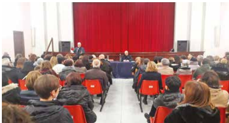
L'INCONTRO AD ASSEMINI

D opo l'invocazione dello Spirito Santo, nel salone della Beata Vergine del Carmine ad Assemini si è tenuto l'incontro dell'arcivescovo,