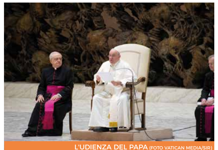
L'UDIENZA DEL PAPA

pore. Gesù è venuto «a proclamare l'anno di grazia del Signore» (Lc 4,19). Con Dio «la grazia che fa nuova la vita arriva e stupisce sempre. Cristo è il "Giubileo" di ogni giorno, di ogni ora, che ti avvicina, per accarezzarti e perdonarti». Per questo l'annuncio di Gesù «deve portare sempre lo stupore della grazia [...] che, anche attraverso di noi, compie cose imprevedibili». Concludendo la sua catechesi, papa Francesco ha messo in luce