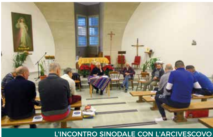
L'INCONTRO SINODALE CON L'ARCIVESCOVO

Il secondo anno del cammino sinodale è stato recepito dai partecipanti del gruppo del carcere con gioia e impegno, vista l'esperienza positiva vissuta nel primo anno, e con il desiderio di portare avanti dei progetti e delle riflessioni per poter raggiungere alcuni ambiti della società, in particolare le frange della povertà e dell'indigenza, proprio a partire dalla situazione dolorosa di reclusione che ciascuno vive. In tutti è sempre stato chiaro che l'esperienza del gruppo sinodale non può essere «rinchiusa» dentro le pareti di un carcere ma deve essere, in qualche modo, trasmessa per aiutare quanti si sentono soli,