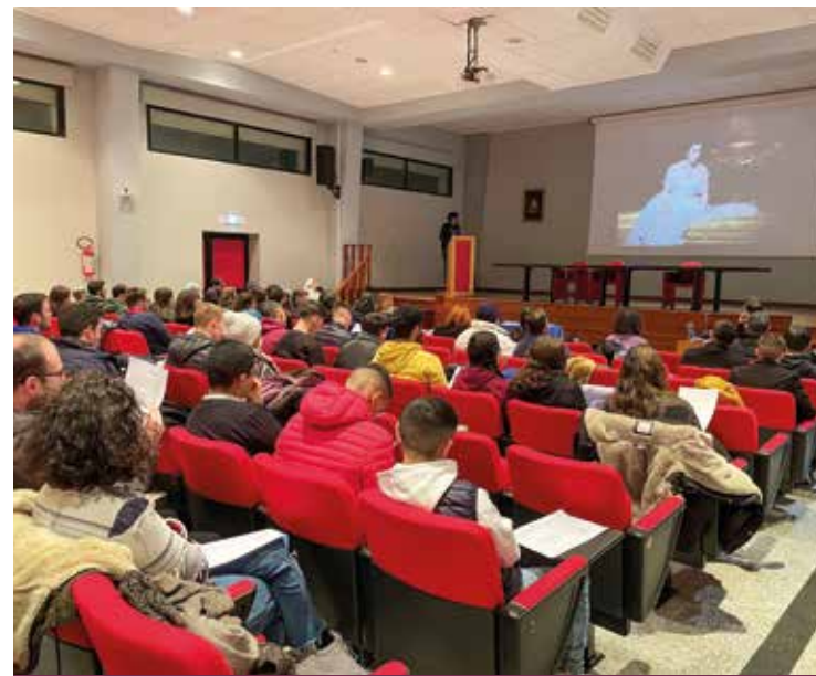
L'INCONTRO IN SEMINARIO

persona nonostante il fallimento, perché chi lavora sa contare i propri fallimenti e i propri successi e, sulla Sua Parola, gli Apostoli fanno esperienza di sovrabbondanza, ricchezza, sennò seguire il Signore diventa ripiego e insoddisfazione». Dalla meditazione è emerso anche che la vocazione si nutre di fede, una fede che ti pone davanti all'interrogativo: «Tu sei il Cristo, ma chi è Cristo per te?» (cf. Mc 8,27-33). In questo senso Pietro è letteralmente un esempio: prima risponde con fede su chi è veramente Cristo, poi quando Gesù dice che dovrà soffrire e morire quasi lo rimprovera ed è proprio in quel frangente che Gesù gli ricorda che per amare ed amarlo deve mettersi alla sua sequela. Pietro è quindi esempio perché è sincero, onesto, trasparente, non si nasconde: ecco