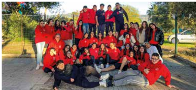
GIOVANI DELL'ORATORIO SANTA GRECA