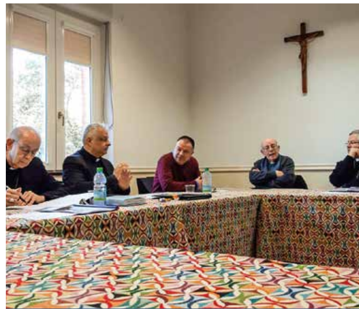
L'INCONTRO DI ORISTANO

l'editoria locale deve affrontare per i costi crescenti della carta, il ricambio generazionale e la disaffezione ai media tradizionali, la formazione digitale e l'apertura all'ambiente digitale. Centrale il tema del lavoro, dei contratti che riconoscano la professionalità dei giornalisti impegnati nei media diocesani e l'importanza di una formazione opportuna, alla luce dell'importante servizio cui sono chiamati. Un cammino e un dialogo che procede quello tra la Fisc regionale e la Conferenza episcopale sarda. Da parte di tutti i Vescovi è emersa attenzione alla progettualità, unitaria ma rispettosa delle identità locali. Superata da tempo la prospettiva di un