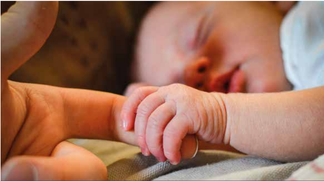
UN NEONATO IN OSPEDALE