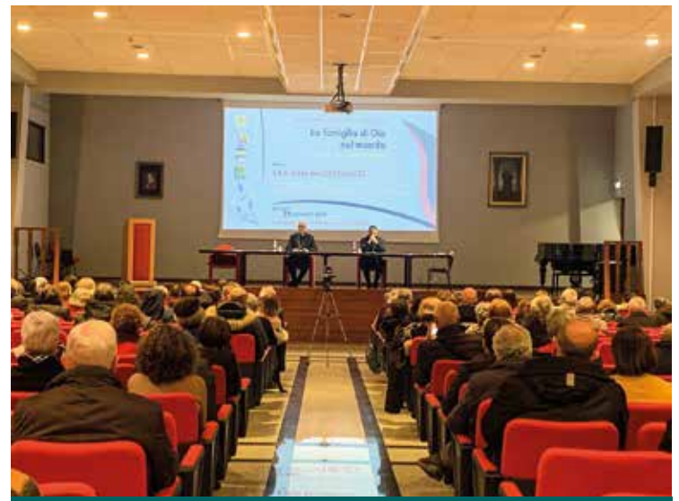
L'INCONTRO IN SEMINARIO

neato da monsignor Castellucci è quello relativo ai due atteggiamenti che segnano la prospettiva di molte persone: il rigorismo e il relativismo. Entrambi non permettono né dialogo né ascolto. Per l'arcivescovo di Modena-Nonantola, in questo nuovo anno del cammino sinodale, le comunità hanno la possibilità di proseguire la fase di ascolto delle diverse istanze, con particolare attenzione verso chi è lontano e sente la difficoltà di avvicinarsi alla parrocchia. Un invito ad