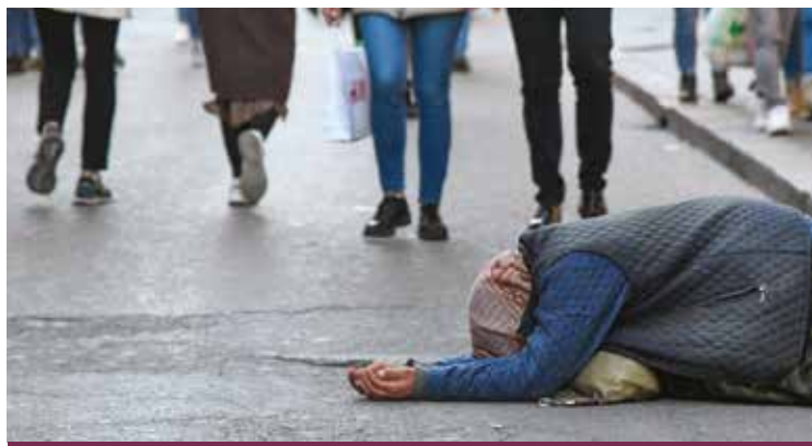
UN POVERO CHIEDE L'ELEMOSINA

I gran freddo che ha caratterizzato le ultime settimane ha creato disagi e difficoltà, specie nelle zone interne.