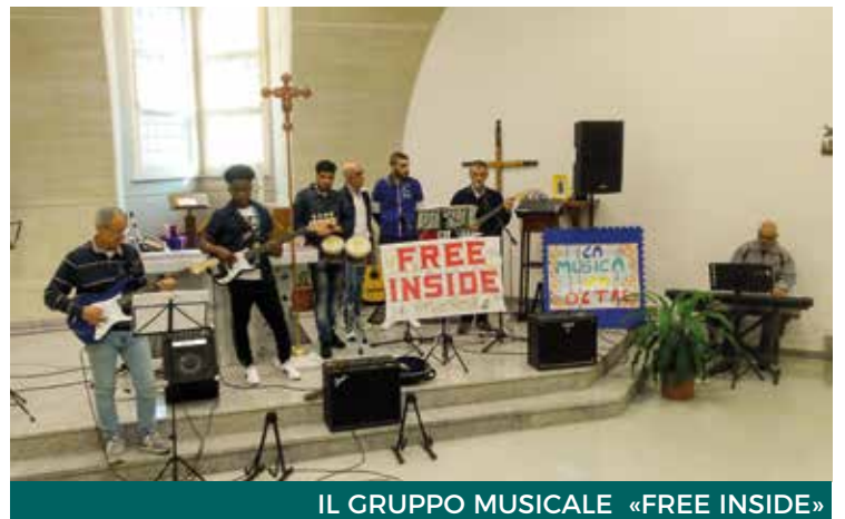
IL GRUPPO MUSICALE «FREE INSIDE»