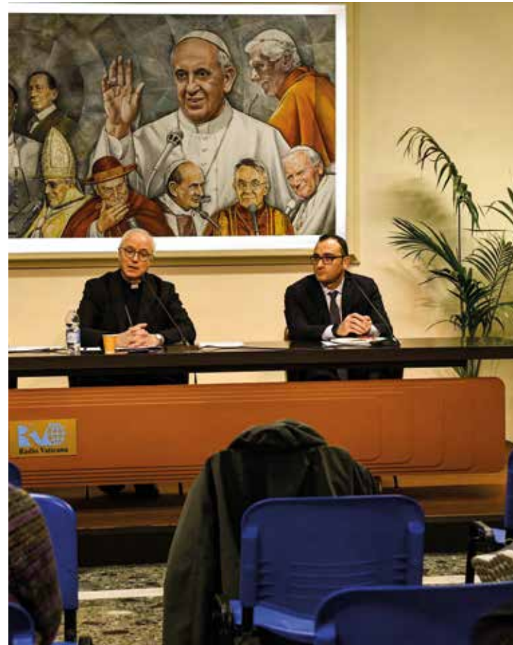
LA CONFERENZA STAMPA DI MONS. BATURI

Nella conferenza stampa, al termine dei lavori del Consiglio Permanente, monsignor Giuseppe Baturi, arcivescovo di Cagliari e segretario generale della Cei, ha sottolineato l'importanza della collaborazione tra la Chiesa e lo Stato per la costruzione del bene comune: «Abbiamo espresso gli auguri al nuovo Governo e dato la nostra disponibilità a tutto campo. Sono aperti diversi tavoli