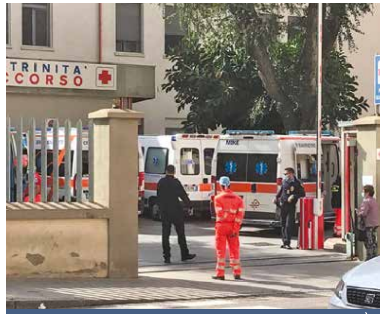
L'INGRESSO DEL PRONTO SOCCORSO DEL P. O. «SS. TRINITÀ»

Lo scorso anno, con il ritorno alla lenta normalità, si sono presentati 328.030 pazienti ma nel 2019 i morti in pronto soccorso sono stati 601, nell'anno appena concluso sono saliti a 866. Il 44% in più: una cifra elevatissima, visto che nel 2020 i decessi dichiarati sono stati 630, scesi a