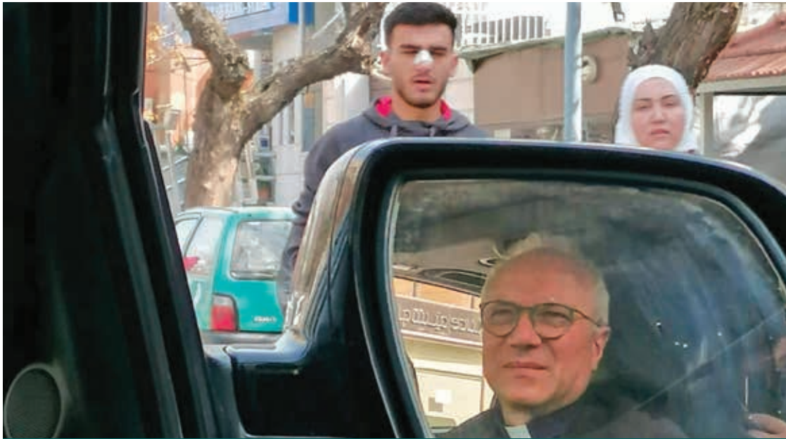
MONSIGNOR BATURI A DAMASCO