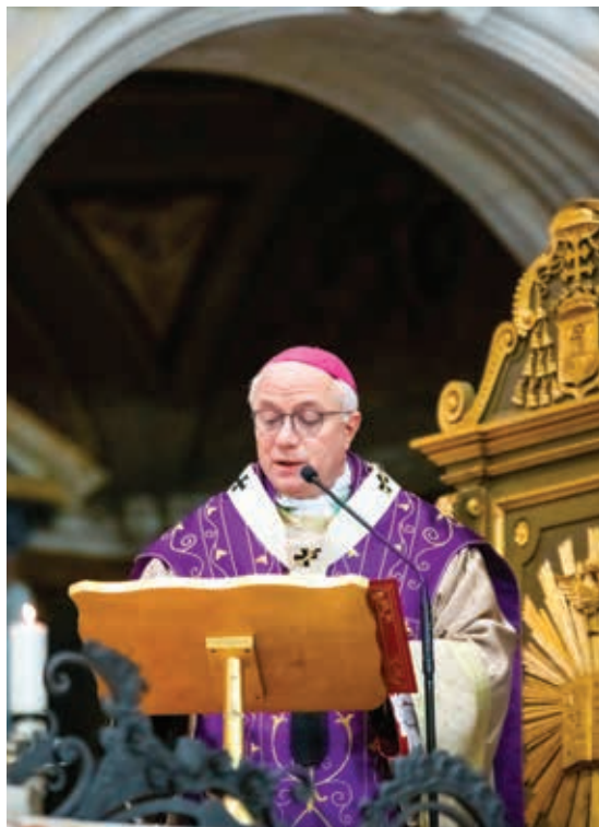
MONSIGNOR GIUSEPPE BATURI

L'invito della Quaresima dunque è quello di tornare alle cose profonde. «Andare al cuore ha specificato Baturi - a quel segreto carico di memorie e di desiderio: ciò che siamo lo si vede in quel desiderio di profondità. È nel profondo di quel segreto che Dio può essere riconosciuto come Padre. Nell'incontro con la