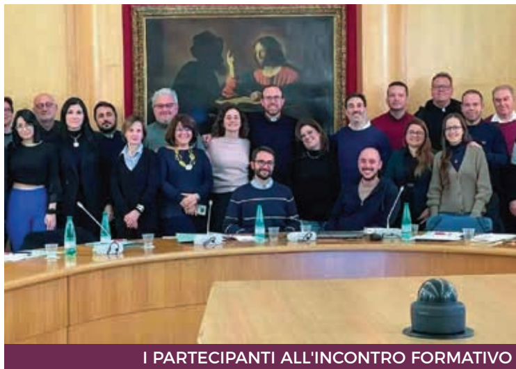
I PARTECIPANTI ALL'INCONTRO FORMATIVO

Si è svolto a Roma l'incontro di formazione per i Tutor di nuova nomina del Progetto