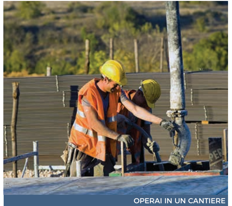
OPERAI IN UN CANTIERE

Il tempo stringe e non sembrano esserci le figure necessarie per la messa in opera degli interventi previsti dal Piano in Sardegna. Anche volendo reperirle occorrerebbero diversi mesi prima