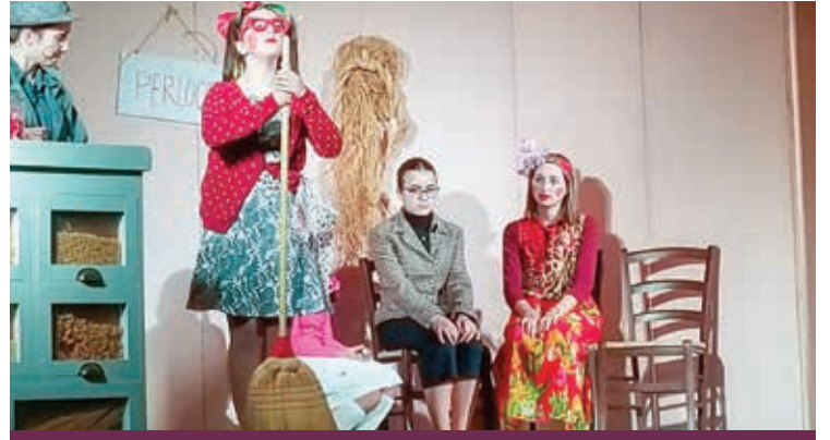
LO SPETTACOLO A SANTELIA

La F.I.T.A. è la maggiore associazione italiana con circa 1.400 compagnie affiliate in tutto il territorio nazionale, il cui scopo è la promozione del teatro in tutte le sue manifestazioni e che anche attraverso il coinvolgimento delle nuove generazioni permette di veicolare messaggi sociali a loro cari. L'adesione a un circuito nazionale, inoltre, consente al Comitato di confrontarsi con