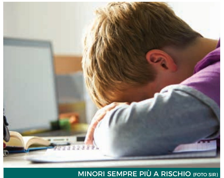
MINORI SEMPRE PIÙ A RISCHIO

Già da diversi anni la Polizia Postale e delle Comunicazioni della Sardegna, organizza nelle scuole dell'Isola incontri con i ragazzi delle superiori, nei quali si affrontano temi quali «L'uso consapevole della rete e dei suoi pericoli», il «Revenge Porn - Sexting - Adescamento», sino al «Bullismo e Cyber-bullismo». Solo in questo anno scolastico sono previsti 50 incontri e nel frattempo partecipano 6.500 alunni con una settantina di insegnanti, una bella platea per