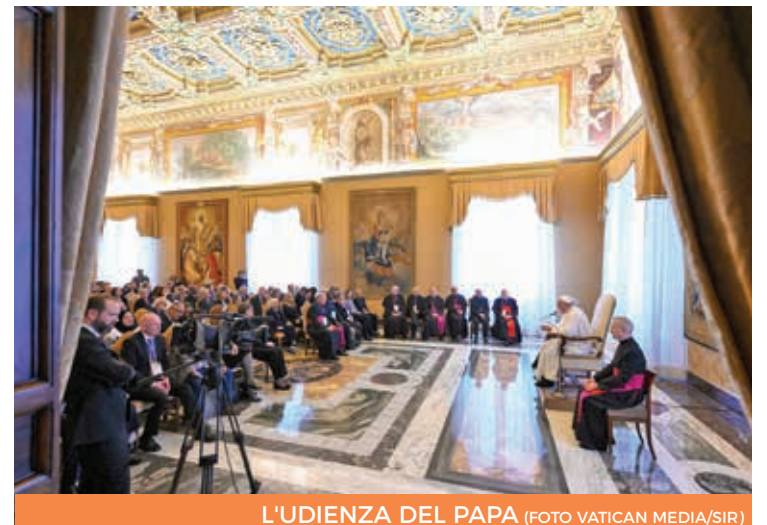
L'UDIENZA DEL PAPA

Quando si parla, ad esempio, di uomo «aumentato», riferendosi alle «tecnologie di potenziamento delle funzioni biologiche di un soggetto», sarebbe fuorviante dimenticare «che il corpo umano rinvia al bene integrale della persona e che dunque non può essere identificato con il solo