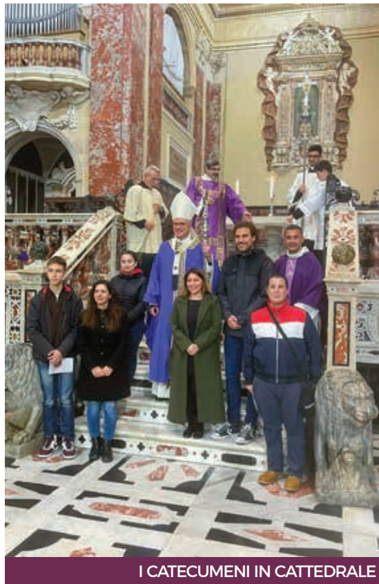
I CATECUMENI IN CATTEDRALE

Per gli «eletti» ora si apre il cammino dell'ultima Quaresima caratterizzato dalla celebrazione degli scrutini e dei riti preparatori alla Veglia Pasquale.