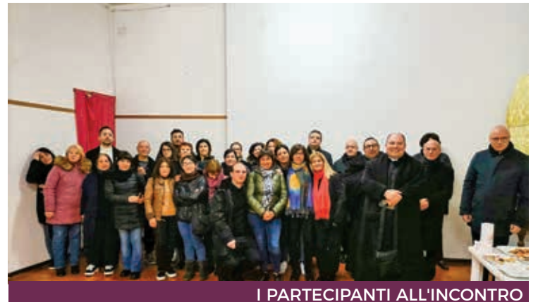
I PARTECIPANTI ALL'INCONTRO

senziale, attraverso l'ausilio di immagini da colorare e sull'esigenza di un più ampia varietà di sussidi ricchi di illustrazioni, per cercare di rispondere in maniera più esauriente alle domande dei bambini e dei ragazzi sempre più desiderosi di fare esperienze visive. Successivamente si è discusso su come favorire la partecipazione dei ragazzi e delle rispettive famiglie alla Messa, fonte e culmine della vita cristiana. L'Arcivescovo inoltre è intervenuto sul come deve essere percepita la figura del catechista: non solamente come un insegnante trasmettitore di contenuti sulla Rivelazione, ma come un educatore che deve prendersi cura di quel bambino che cerca di darsi delle risposte alle domande sul senso