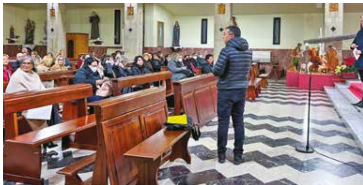
INCONTRO FORANIALE DEI CATECHISTI A SAN GIUSEPPE

D opo gli incontri dei catechisti nelle singole foranie con l'Arcivescovo, vissuti nello scorso anno pastorale e finalizzati ad una rinnovata pro-