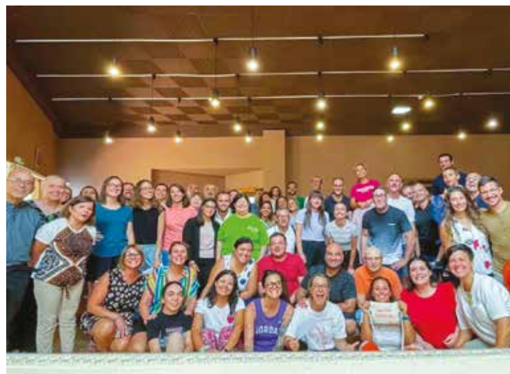
I PARTECIPANTI AL CONVEGNO NAZIONALE DEL TLC A CAGLIARI