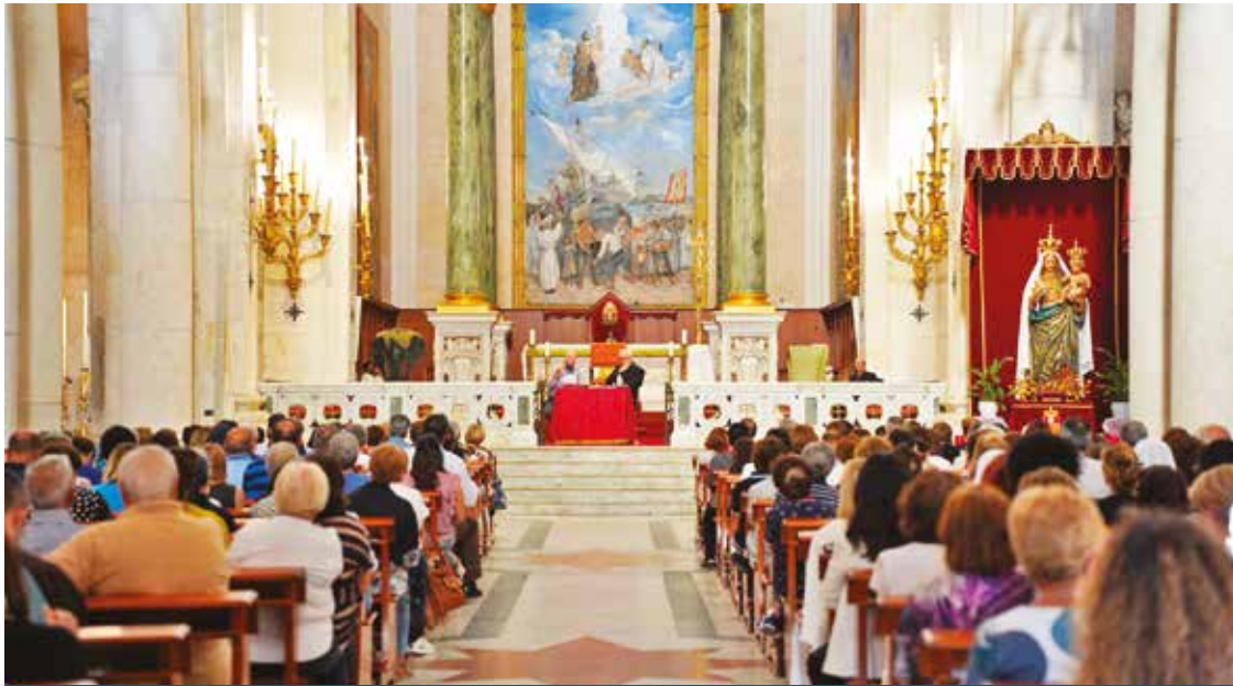
L'INCONTRO A BONARIA