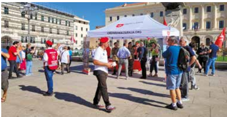
UNO STAND DELL'ORDINE DI MALTA

S i è svolta sabato 14 ottobre la giornata Nazionale dell'Ordine di Malta, che ha coinvolto 34 piazze italiane e 10 nel mondo.