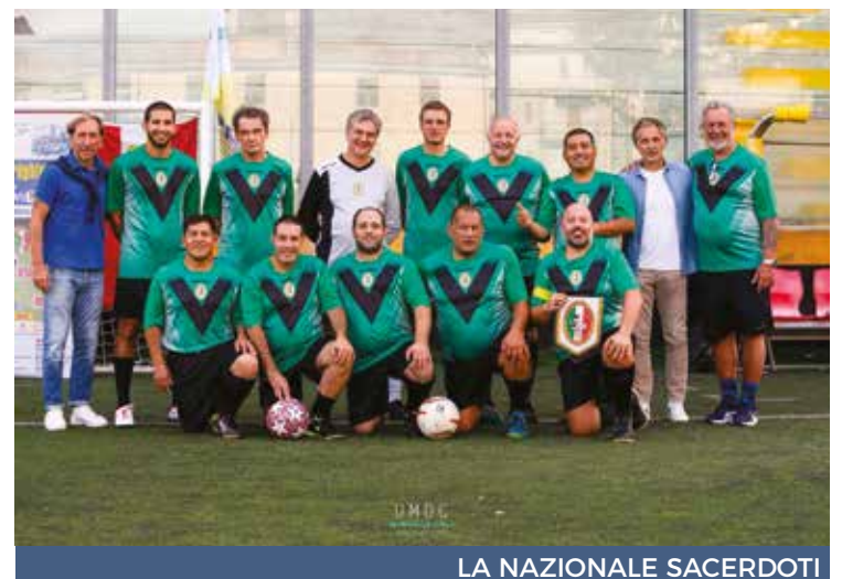
LA NAZIONALE SACERDOTI