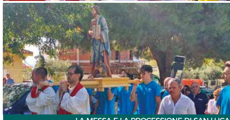
LA MESSA E LA PROCESSIONE DI SAN LUCA