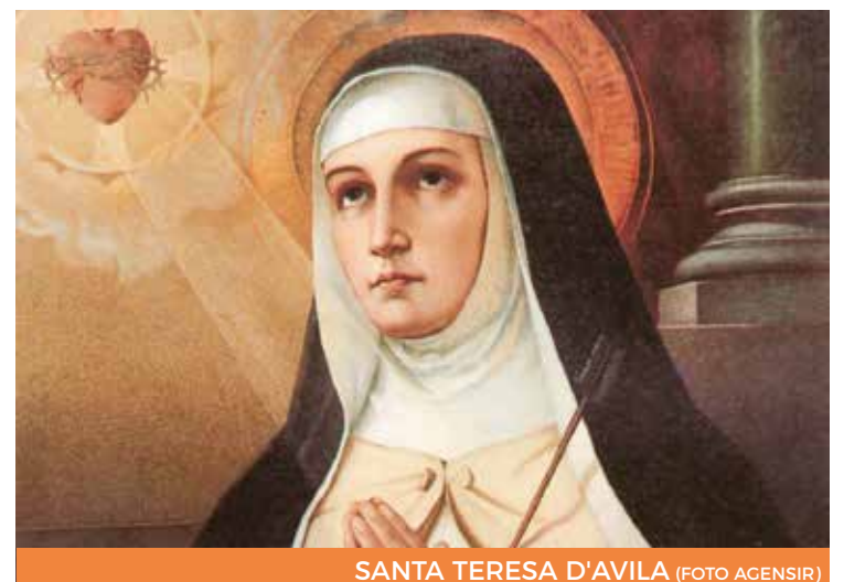
SANTA TERESA D'AVILA

Riprendendo il messaggio di «Evangelii gaudium», il Santo Padre ha fatto notare come una Chiesa missionaria si debba con-