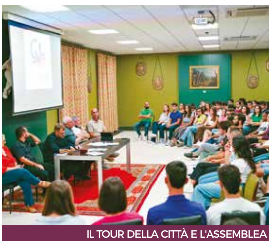
IL TOUR DELLA CITTÀ E L'ASSEMBLEA

te ad accrescere il bagaglio culturale e personale degli studenti.