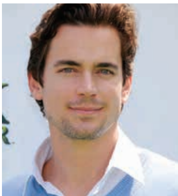
COLMAN DOMINGO E MATT BOMER

Dal 20 al 23 giugno a Cagliari e al Forte Village di Santa Margherita di Pula, si svolge la 7ma edizione di «Filming Italy Sardegna Festival», ideato e diretto da Tiziana Rocca. Star di eccezione Colman Domingo e Matt Bomer, verranno pre-