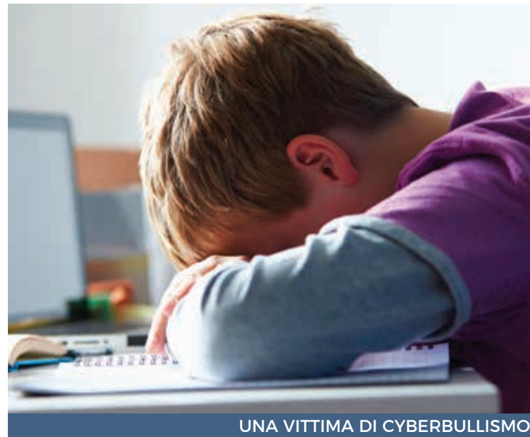
UNA VITTIMA DI CYBERBULLISMO

La legge per il contrasto di bullismo e cyberbullismo entrata da poco in vigore agevolerà la lotta al fenomeno più di quanto ab-