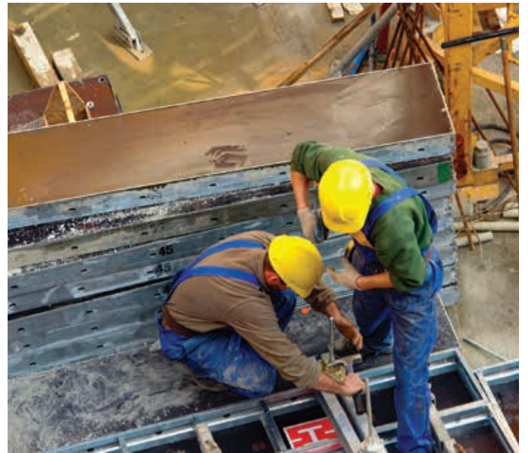
OPERAI IN UN CANTIERE

La fotografia che emerge dal report, in base alle province Nuoro, rispetto al 2019, registra la crescita più importante +46%, grazie