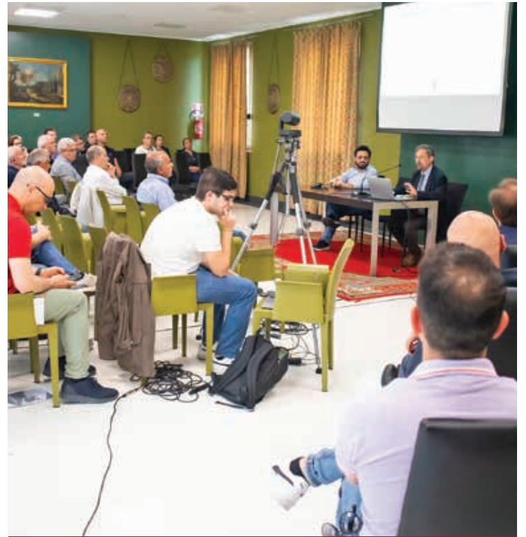
L'INCONTRO IN SEMINARIO