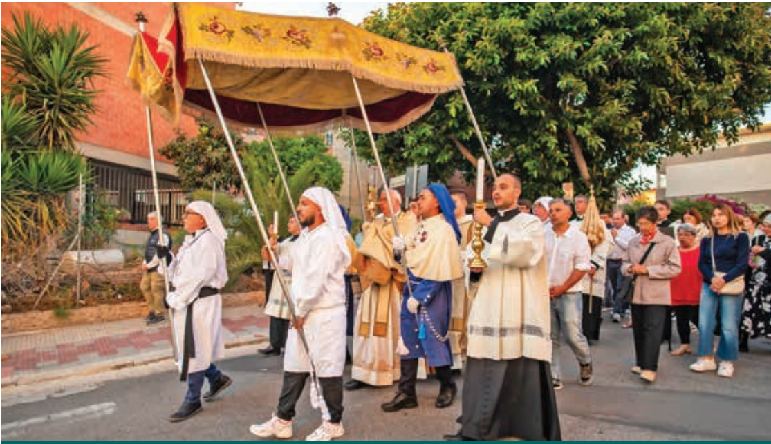
LA PROCESSIONE PER LE STRADE DI IS MIRRIONIS