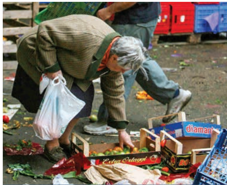
ALLA RICERCA DI CIBO TRA I RIFIUTI

se a trovare soluzioni efficaci. Da qui la richiesta affinché la nuova Giunta si metta in azione per ovviare ad una condizione di palese disparità, che interessa una buona fetta di sardi. Dietro ai numeri ci sono le persone, per lo più anziani e pensionati con redditi al minimo, disoccupati e lavoratori poveri, famiglie monoreddito e ex occupati espulsi dal mondo del lavoro ma anche tutti coloro che hanno perso la speranza di trovare una occupazione dignitosa: si tratta di quelle fasce deboli che dopo inflazione e crisi hanno perso capacità di spesa. Il taglio poi di alcune misure di sostegno al reddito ha acuito le difficoltà di chi già navigava in acque agitate sul fronte dell'occupazione e degli ammortizzatori sociali. L'Associazione Nazionale de-