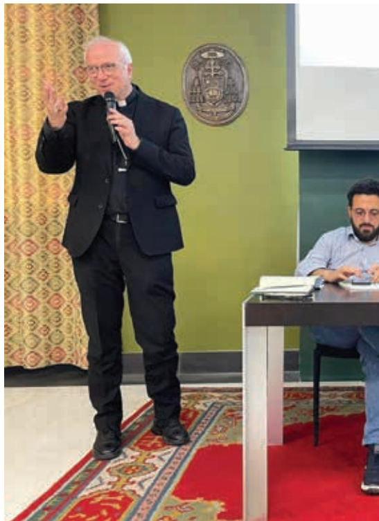
MONSIGNOR GIUSEPPE BATURI

Le comunità energetiche diventano quindi elemento capace di evidenziare il ruolo di ciascuno come attore del cambiamento. «Non è la prima volta - ha