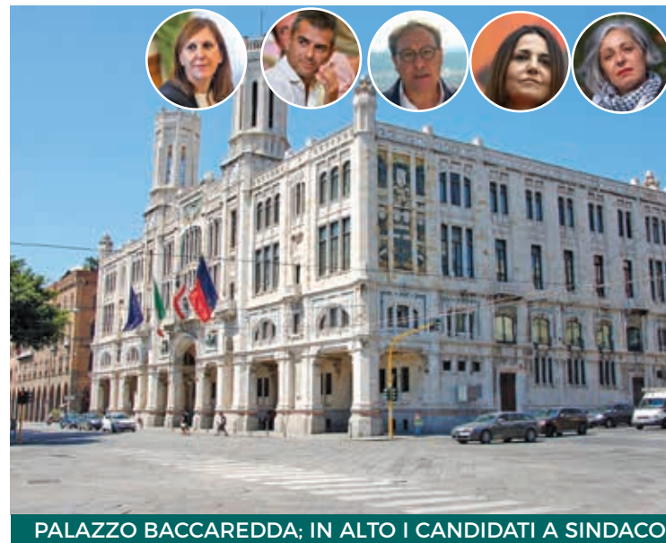
PALAZZO BACCAREDDA; IN ALTO I CANDIDATI A SINDACO

Altra nota dolente è quella relativa all'inquinamento: in città si registrano livelli di polveri sottili molto alti, con i dati che parlano di un superamento del limite sia del PM10 sia quello per il PM2,5. È il frutto delle migliaia di veicoli in entrata e in uscita quotidianamente dal capoluogo, con il trasporto pubblico extra-urbano incapace di venire incontro alle esigenze delle persone, costrette ad utilizzare l'auto per gli spostamenti, mentre i residenti in città