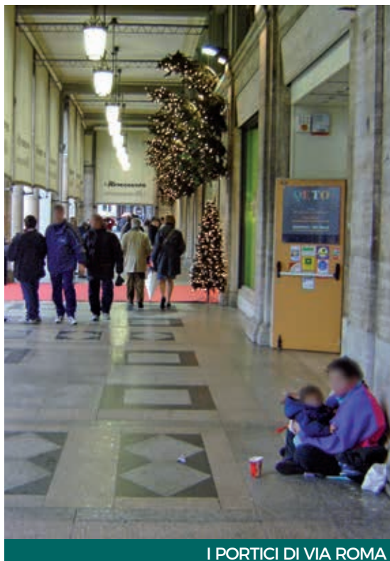
I PORTICI DI VIA ROMA

Un accenno poi è fatto al ruolo di Cagliari come «capitale» della Sardegna. «Al di là dell'attribuzione amministrativa di Cagliari, correttamente «capoluogo» regionale - scrivono gli associati Meic