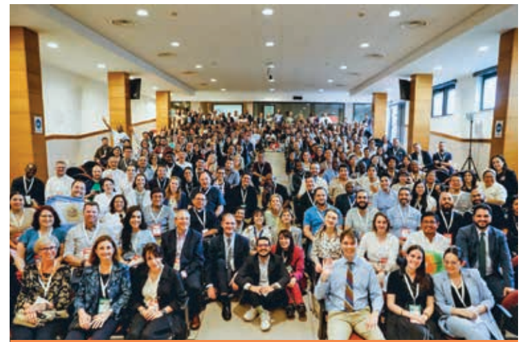
I PARTECIPANTI AL CONGRESSO

deve essere orientato alla verità e all'autenticità. Bisogna «diventare «veri» davanti a sé, davanti agli altri e davanti a Dio».